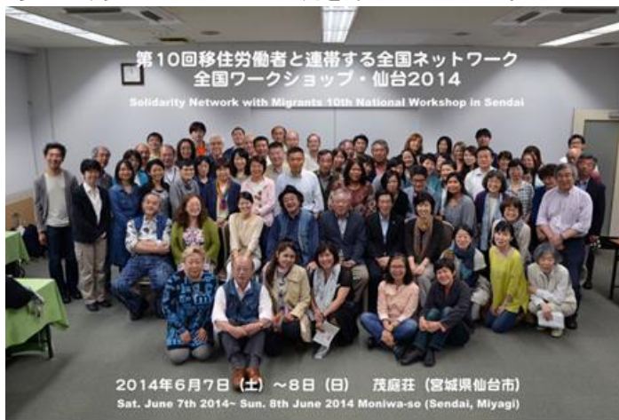
(集合写真、Mネット画像は移住連ホームページより)